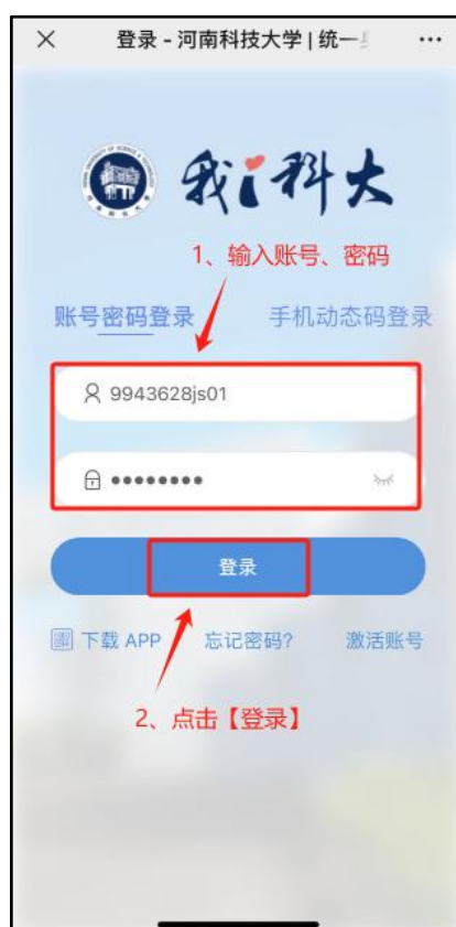
图 3 账号登录