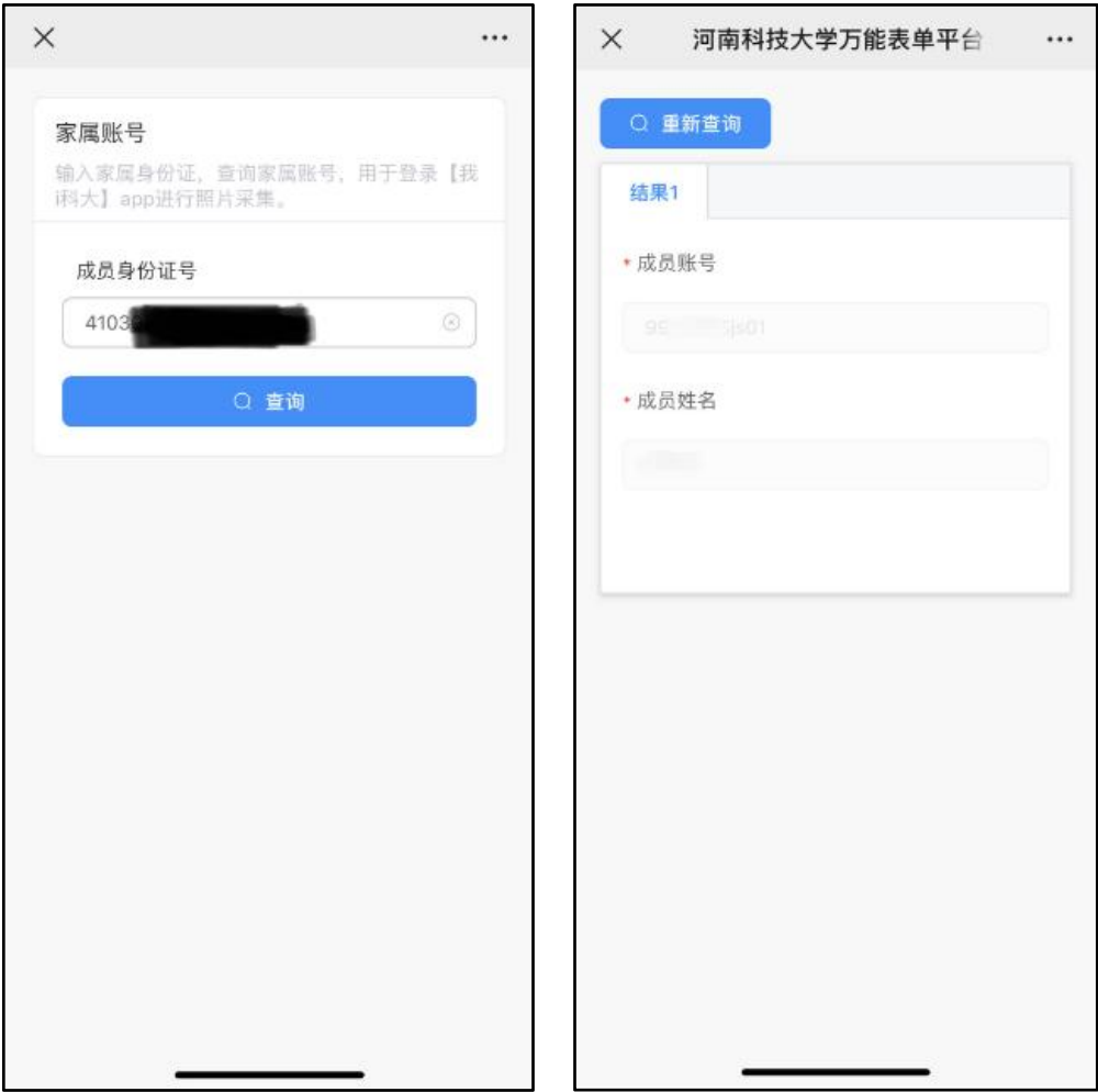
图 1 家属账号查询界面

职工登录“我 i 科大” APP 或电脑端，打开【服务】—【信息服务】—【家属账号查询】应用，输入“成员身份证号”，点击查询，即可查询家属账号。如图 1 所示：