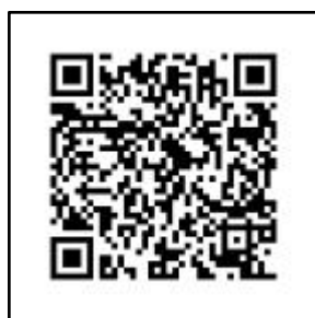
图 2 照片采集二维码