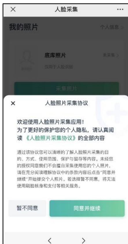
图 5 照片采集协议